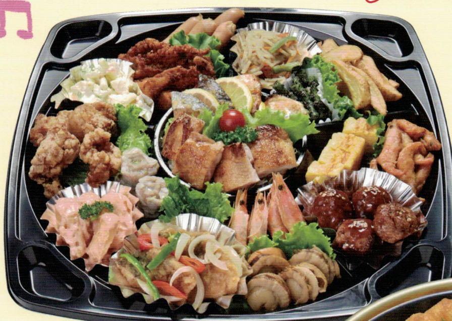
写真はイメージです。