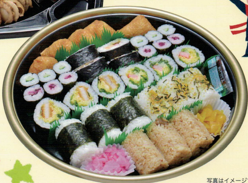
写真はイメージです。